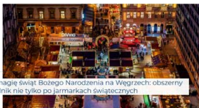
Odkryj magię świąt Bożego Narodzenia na Węgrzech: obszerny przewodnik nie tylko po jarmarkach świątecznych